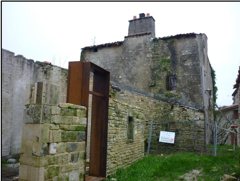
Parcelle n° 7 et façade Sud-Ouest Immeuble parcelle n° 496