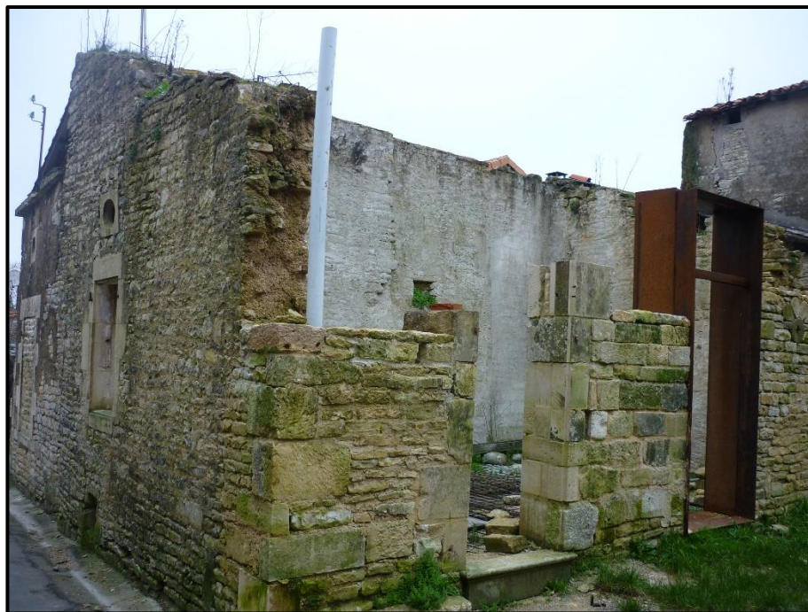
Parcelle n° 7 Pignon sur rue de la Boutonne