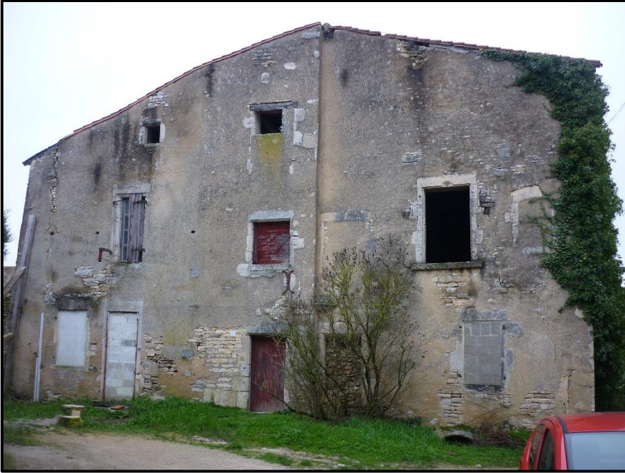
Façade Sud-Ouest sur impasse Beneton